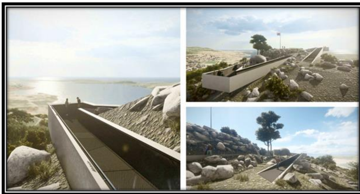
Idejni projekt arhitektonskog ureda NFO

Grad Šibenik odabrao je idejno rješenje za projekt "Rekonstrukcija odmorišta s vidikovcem na Smričnjaku". Odabrano rješenje izradio je arhitektonski ured NFO iz Zagreba, dok su u konkurenciji još bili i ured MVA d.o.o. iz Zagreba i Arhitektonski biro Turato d.o.o. iz Rijeke. Navedeno idejno rješenje Grad Šibenik odabrao je u suradnji s Arhitektonskim fakultetom u Zagrebu i JU "Priroda" Šibensko- kninske županije. Presentacija idejnih rješenja održana je u travnju 2021. godine na Veleučilištu u Šibeniku. Sva ponuđena rješenja bila su izložena u Gradskoj knjižnici "Juraj Šižgorić" i dostupna za razgledavanje zainteresiranoj javnosti.