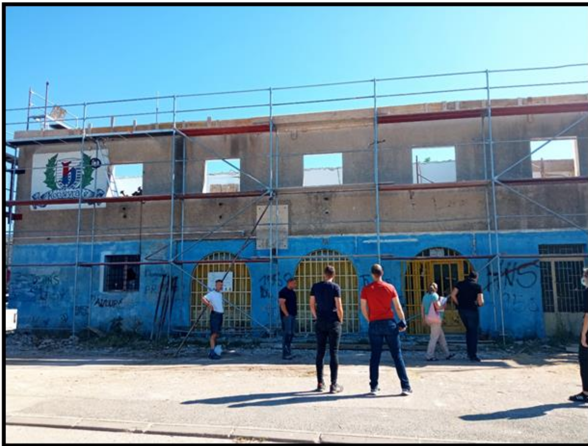
Rekonstrukcija krovišta Društvenog doma na Konjevratima